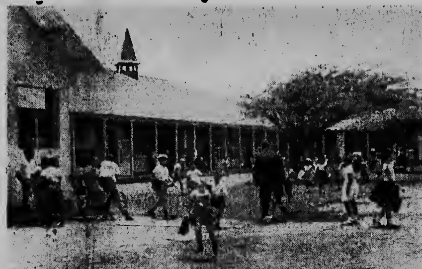
Glistermorgen werd voor het eerst de nieuwe „Mon Plaisir”-school in Oranjestad in gebruik genomen. Hier zien wij het moment, dat de school voor de eerste maal uitgaat. De 7e dezer volgt de officiële opening.

CAIRO — De helft van de vrouwen en kinderen van het Britse ambassadepersoneel in Cairo verlaat in de komende week Egypte — aldus is door een woordvoerder van de ambassade officieel medegedeeld.